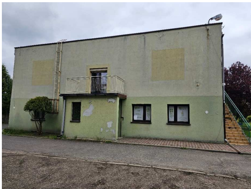
Fot. 3 Elewacja południowa część nowa budynku