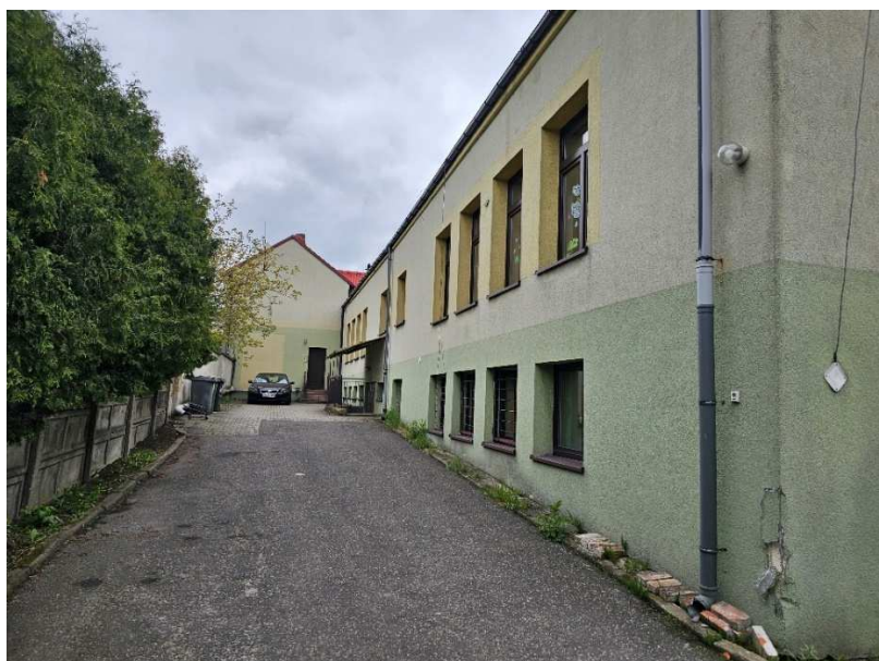
Fot. 4 Elewacja zachodnia części nowej budynku