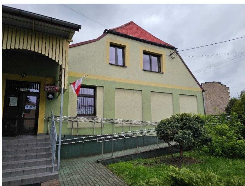
Fot. 1 Elewacja wschodnia część stara budynku